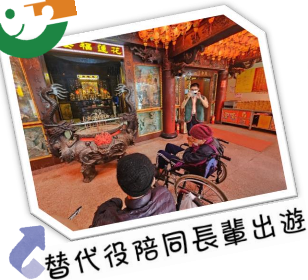
替代役陪同長輩出遊